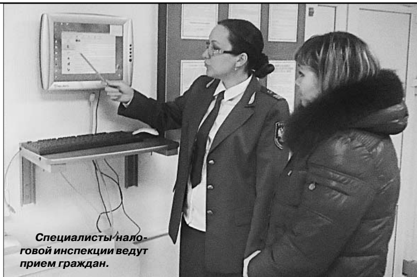
Специалисты налоговой инспекции ведут прием граждан.

Наиболее часто задаваемые вопросы касались предоставления налоговых деклараций при продаже автотранспортных средств, при получении имущества в порядке дарения, о сроках представления налоговых деклараций.