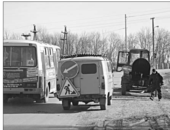
Специальная техника, кадры позволяют проводить ремонт быстрыми темпами.