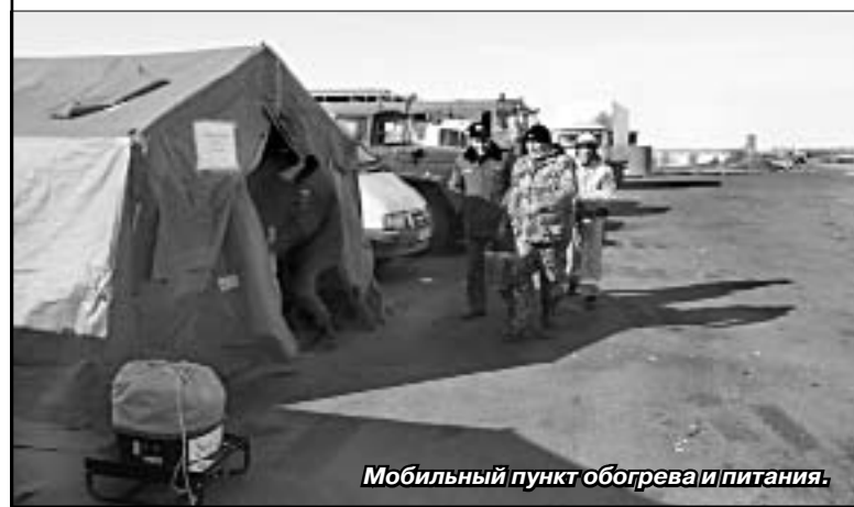
Мобильный пункт обогрева и питания.