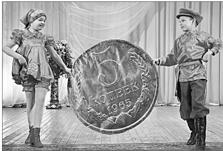
На сцене — танцевальный дуэт из Казинки «Иван да Марья».