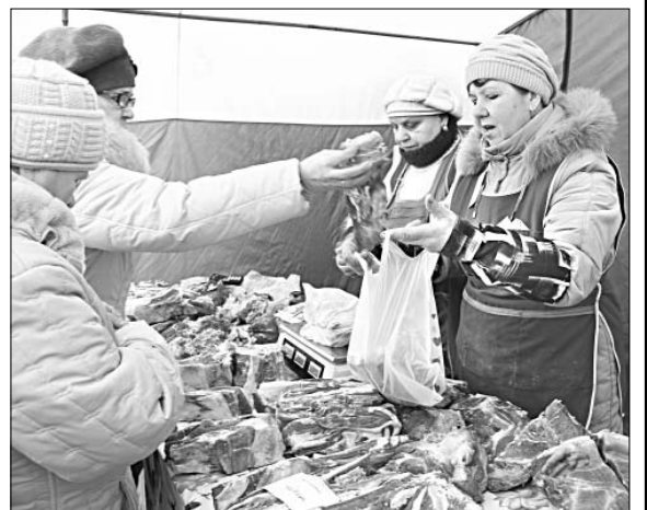
Мясо (кроме свинины) было на ярмарке в изобилии.

Завсегдатаями ярмарок, проводимых в районе, стали Центр допол-