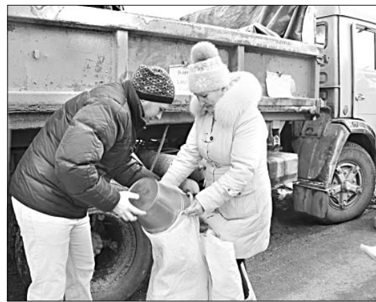
Зерно в хозяйстве пригодится.

расположились на площади перед Домом культуры. Как всегда, ассортимент товаров был представлен широко.