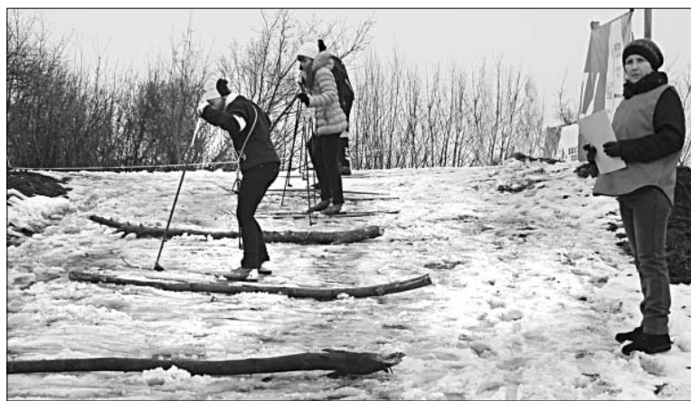
Крутой спуск с преградами преодолевать пришлось каждому участнику команды.