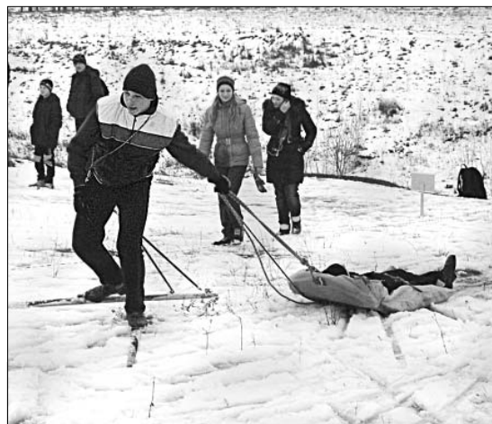
Как доставить пострадавшего в пункт оказания помощи, туристы знают на «отлично».

Опытный турист без труда преодолеет водную преграду и поднимется в гору, не заплутает в незнакомом лесу и разожжет