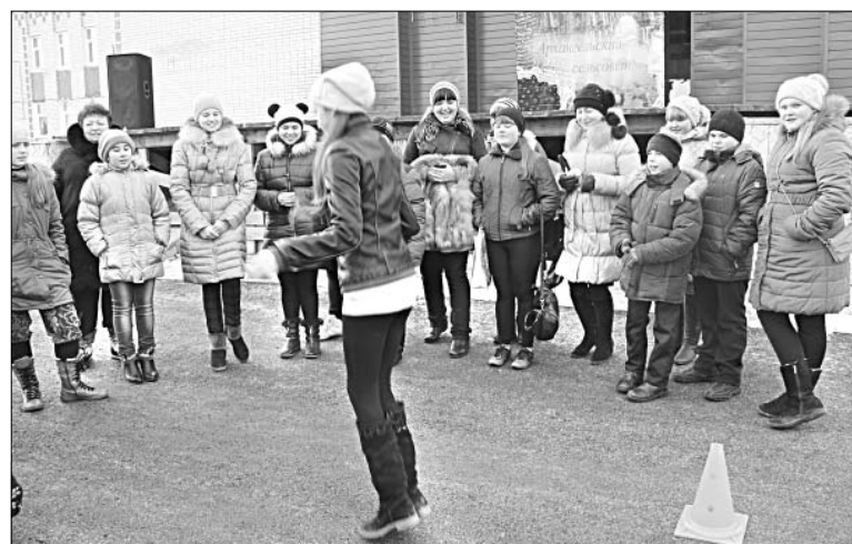
Ребята активно участвовали в развлекательной программе.

Понимая, что следующая неделя масленичная, ООО «Колос-Агро» предложило покупателям пшеничную муку. Цена двухкилограммового пакета 26 рублей. ООО «Липецкптица» торговало куриными яйцами.