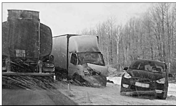
При содействии сотрудников ОГИБДД ОМВД по Елецкому району подготовила А. МИТУСОВА.

МУРЫЕ МЫСЛИ * Трудная, но благодарная работа, общество умного ненавязчивого друга и удобное жилище составляют прочнейшую основу для счастья. А. ГРЕЙ.