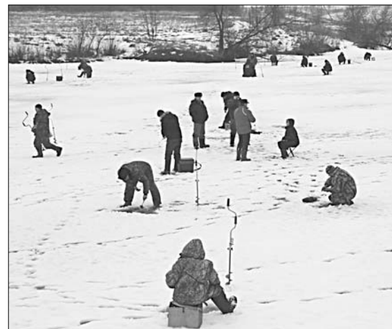
И погода участникам состязаний не помеха.