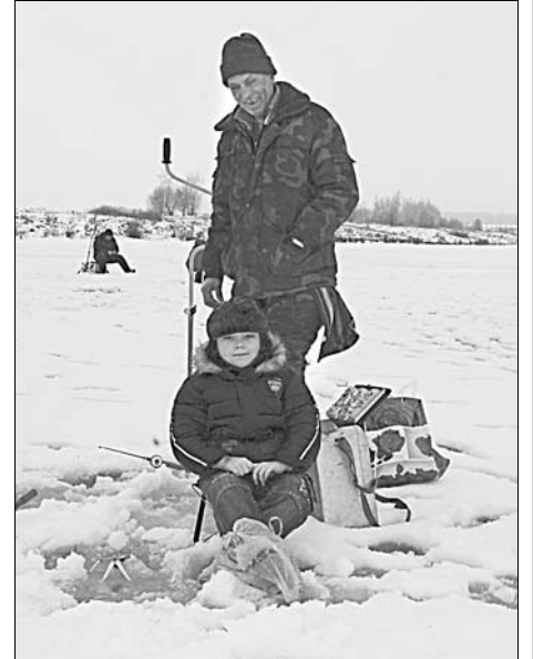
Рыбалку любит и стар и млад.