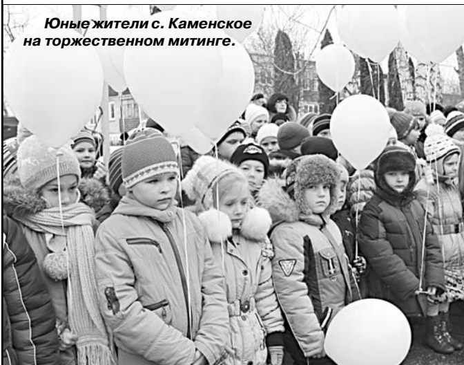
Юные жители с. Каменское на торжественном митинге.