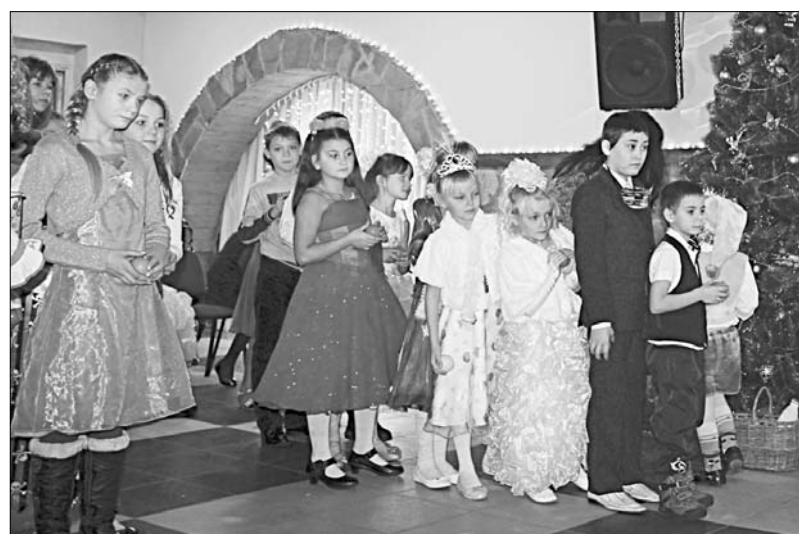
Участники новогоднего утренника.

У сверкающей разноцветными огоньками елки артисты Дома культуры разыграли театрализованное представление по мотивам русской народной сказки «Морозко».