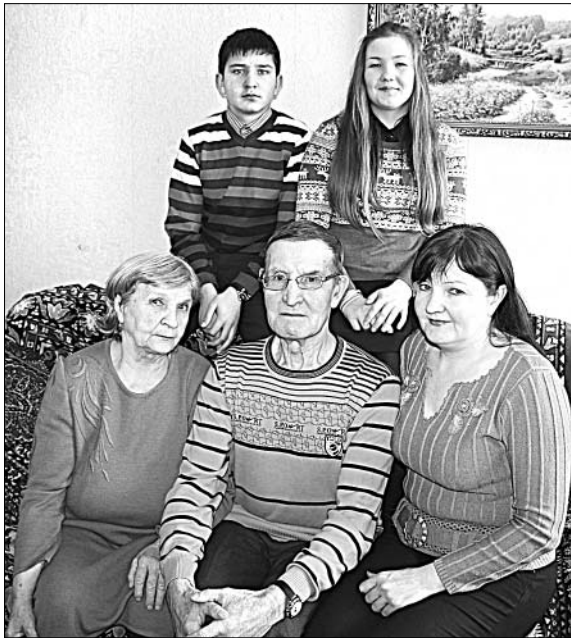
Иван Семенович Ефремов в окружении родных и близких людей.

ской области. Дата его рождения выпала на 14 декабря сурового 41-го. Может, поэтому он по сей день остается крепким телом и духом.