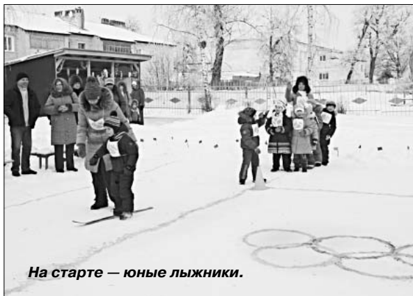
На старте — юные лыжники.