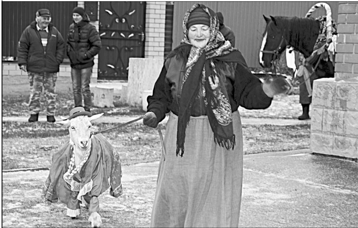
Где еще можно увидеть такое зрелище: коза, родственница барашка, в розовых одеждах, также претендует стать в ряд с символом года наступающего. А лошадь, как видим, уже на заднем плане. Этот снимок сделан во время недавнего семинара по туристическим маршрутам в Колосовском поселении.