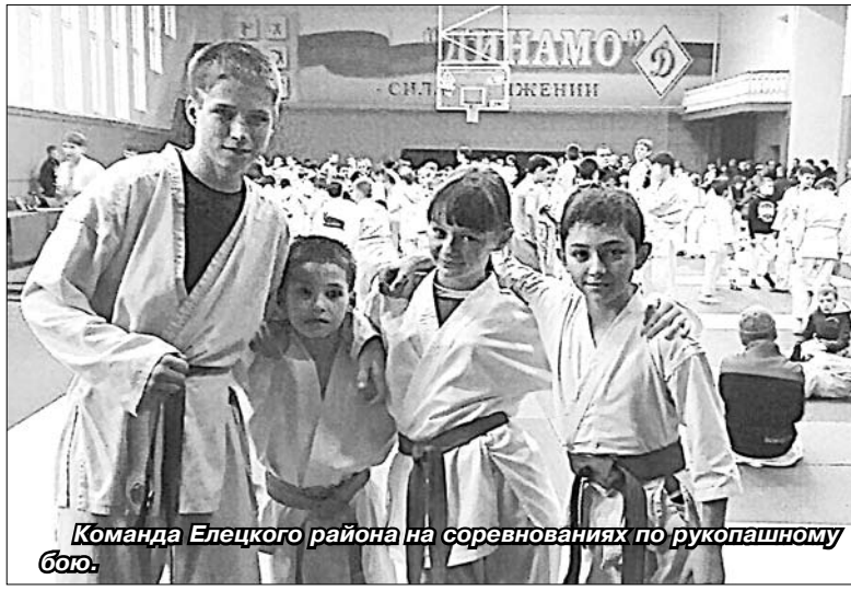
Команда Елецкого района на соревнованиях по рукопашному бою.