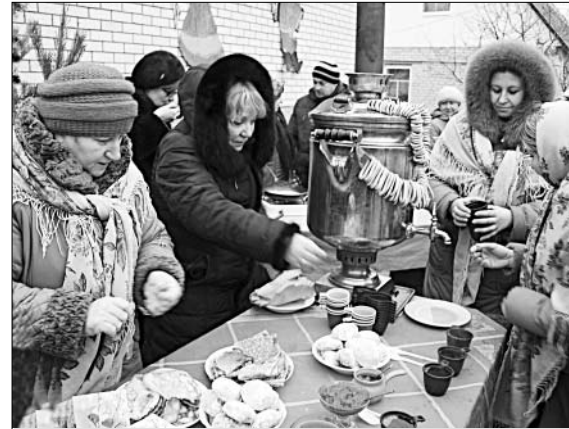
Горячий чай, настоящий на травах, и блины, которые выпекали на улице, всем пришлось по вкусу.