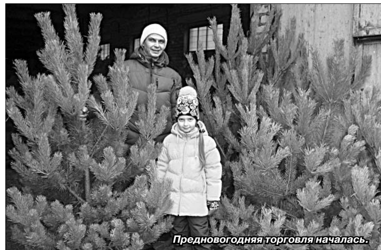
Предновогодняя торговля началась.

В этом году из-за преступной халатности населения, по данным Елецкого лесничества, пострадало шесть гектаров хвойного леса. А нарушитель выявлен всего один. Несмотря на постоянное дежурство лесников, рейды и профилактические беседы, жители продолжают относиться к окружающим их насаждениям потребительски — хорошо выехать на природу тихим погожим деньком, подышать свежим воздухом, особенно чистым в хвойном лесу, украсить дом и порадовать