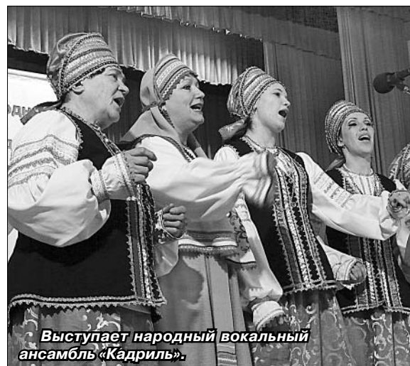
Выступает народный вокальный ансамбль «Кадриль».