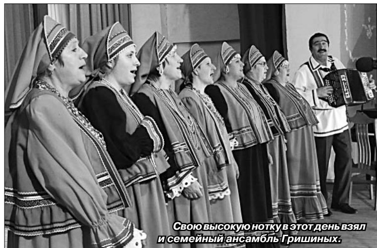
Свою высокую нотку в этот день взяла и семейный ансамбль Гришиных.

конкуренты — народный ансамбль «Кадриль» из Нижневоргольского поселения. Их много, да и поют слаженно — прямо как и мы, — смеется