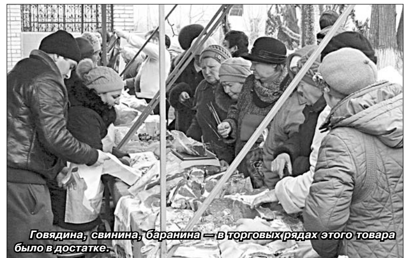
Говядина, свинина, баранина — в торговых рядах этого товара было в достатке.