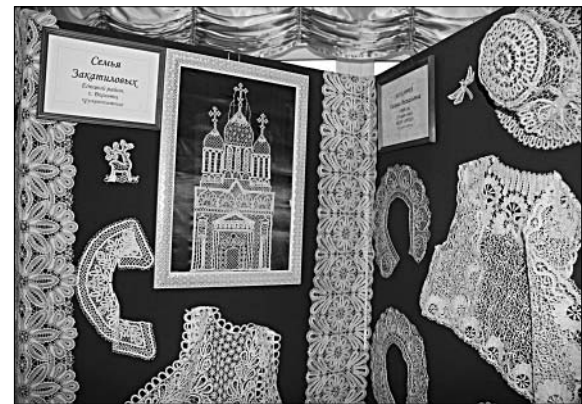
Год от года совершенствуется мастерство кружевниц Закачиловых из с. Воронеж. Мимо такой красоты пройти трудно.

А рядом недавно установлен памятник Черкасскому огурцу, как символ великого трудолюбия