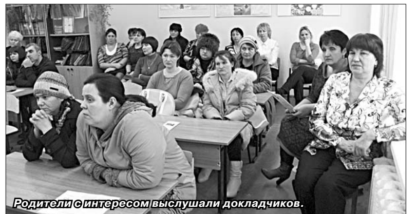
Родители с интересом выслушали докладчиков.