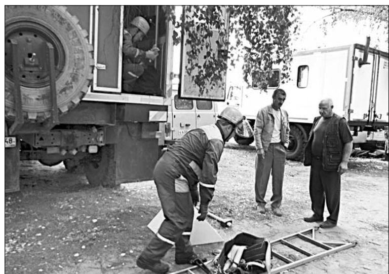
Областной конкурс профессионального мастерства — экзамен. Его специалисты Елецкого РЭС всегда сдают на «отлично».