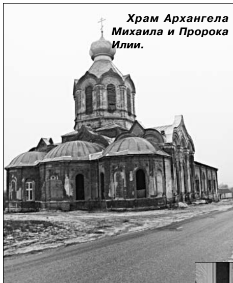
Храм Архангела Михаила и Пророка Илии.