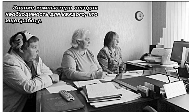
Знание компьютера сегодня необходимость для каждого, кто ищет работу.

Желающие воспользоваться услугой службы занятости по получению новой профессии могут обратиться к инспектору в центр занятости Елецкого района по адресу: п. Солидарность, ул. Лесная, д. 9 «а», т.: 9-84-37, 9-84-35, по электронной почте — e-mail: elc2nr@yelets.lipetsk.ru или в МФЦ Елецкого района. (Р)