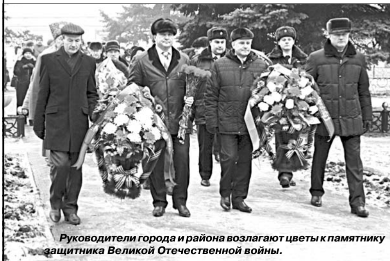
Руководители города и района возлагают цветы к памятнику защитника Великой Отечественной войны.