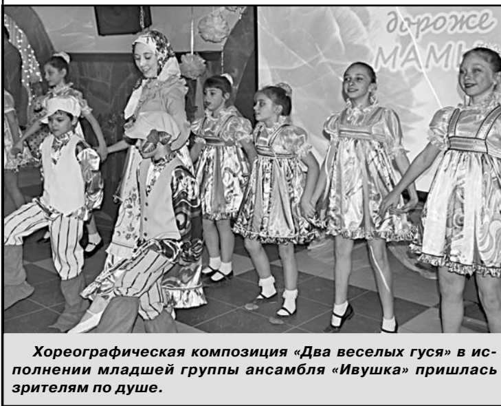
Хореографическая композиция «Два веселых гуся» в исполнении младшей группы ансамбля «Ивушка» пришлась зрителям по душе.