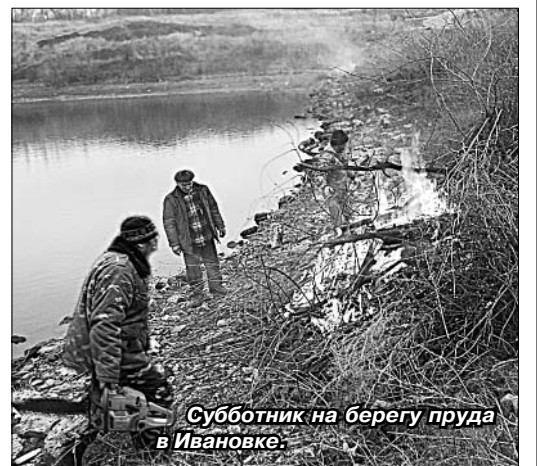
Субботник на берегу пруда в Ивановке.