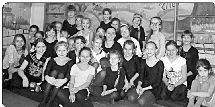
«Дива» учит улыбаться.