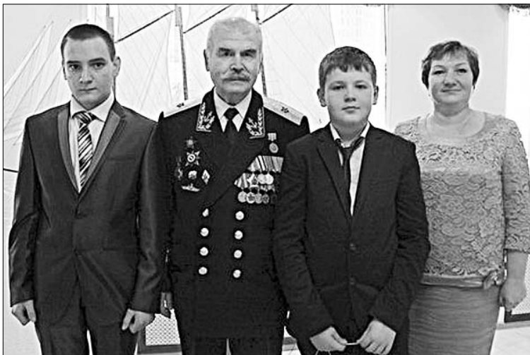
Призеры конкурса «Морской венок славы» от нашего региона.