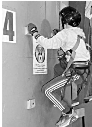
Многие ребята успешно преодолели все испытания.