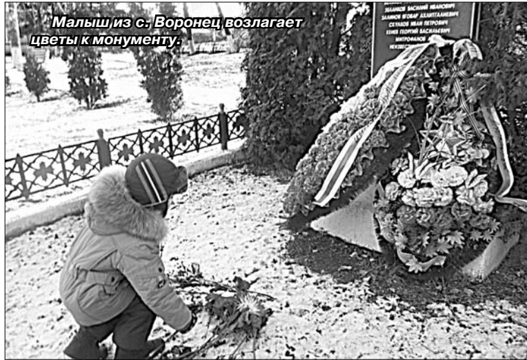
Малыш из с. Воронеж возлагает цветы к монументу.