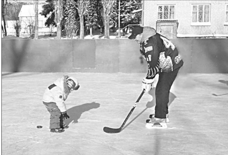
На новой спортивной площадке в п. Елецкий найдется место и взрослым и малышам.

сле торжественного открытия. Места здесь хватило всем. Ребятам гурьбой высыпала на лед. Некоторых малышей родители впервые привели на каток. Специально к этому дню по-