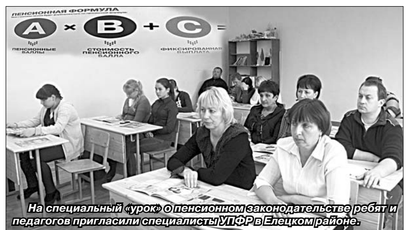
На специальный «урок» о пенсионном законодательстве ребят и педагогов пригласили специалисты УПФР в Елецком районе.