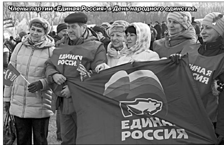
Члены партии «Единая Россия» в День народного единства.