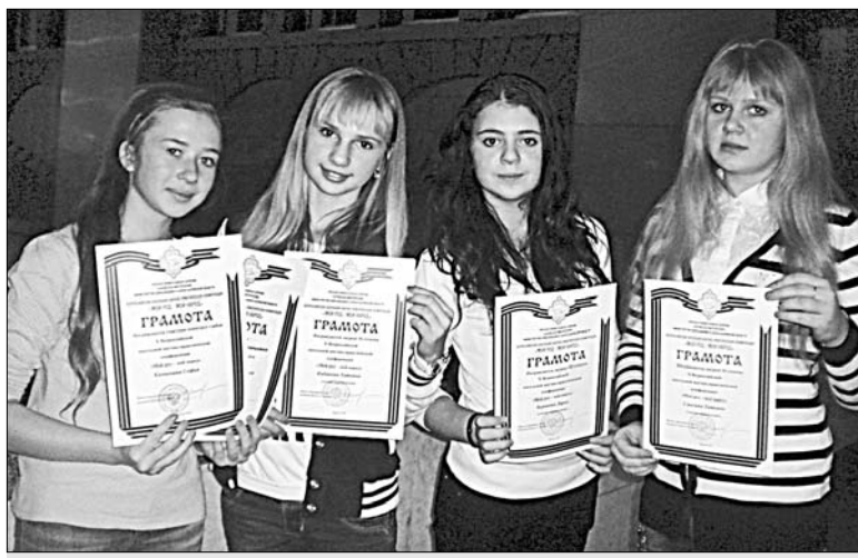
Воспитанницы районного Центра детско-юношеского туризма с наградами конференции.