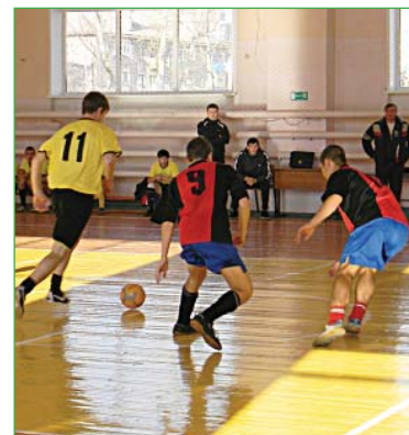
На футбольном «поле» ребятам пришлось не только продемонстрировать свою подготовку, но и проявить и силу воли.

Н. ШАЛЕЕВА, методист районного Центра дополнительного образования детей.