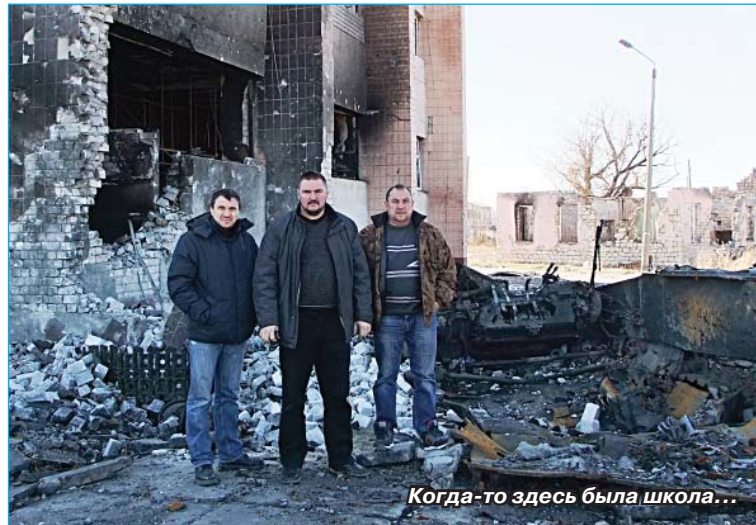
Когда-то здесь была школа...

Война на юге Украины задела своим крылом не одну российскую семью, в том числе и нашего района. В деревнях и селах разместились и живут около 400 беженцев из Донбасса, Луганска, других населенных пунктов. Им, вдали от своей родины, непросто налаживать быт, выстраивать отношения.