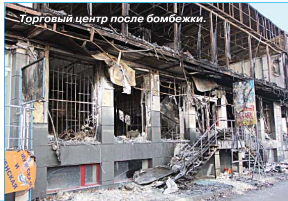
Торговый центр после бомбежки