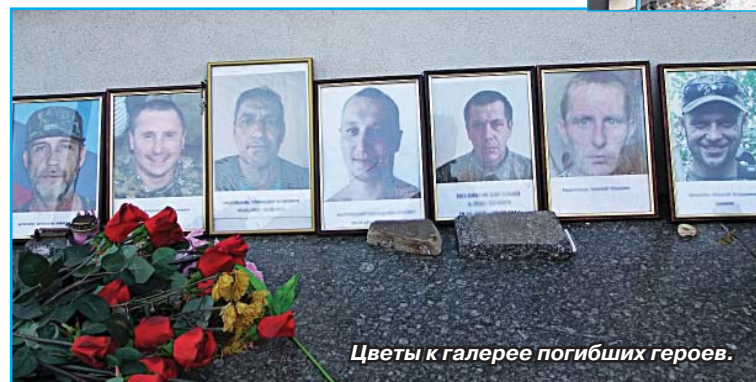
Цветы к галерее погибших героев