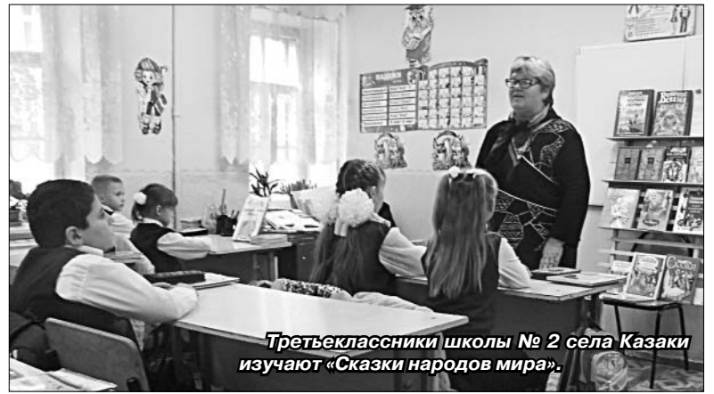
Третьеклассники школы № 2 села Казаки изучают «Сказки народов мира».