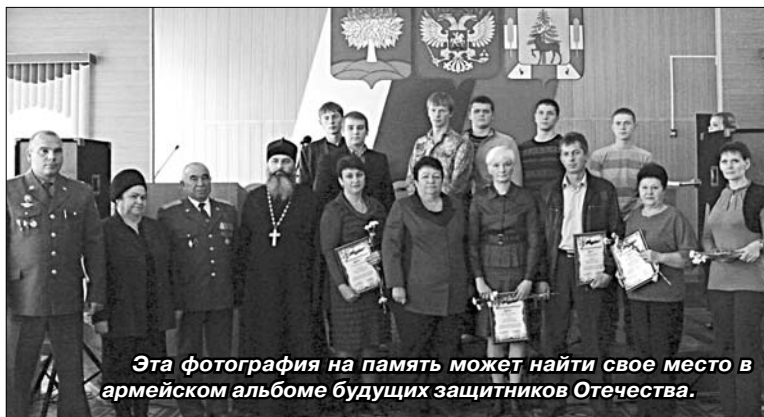
Эта фотография на память может найти свое место в армейском альбоме будущих защитников Отечества.

Кстати, на встрече было положено начало новой традиции. Призывникам вручили открытки с обратным адресом, на которых они могут из армии написать пожелания тем, кто пойдет служить в 2015-м. Эти письма обязательно прочтут на такой же