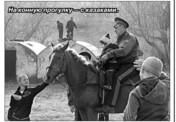
Наконную прогулку — сказками.