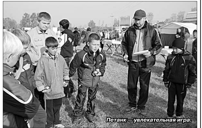
Петанк — увлекательная игра.