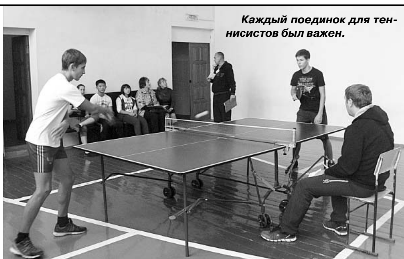
Каждый поединок для теннисистов был важен.