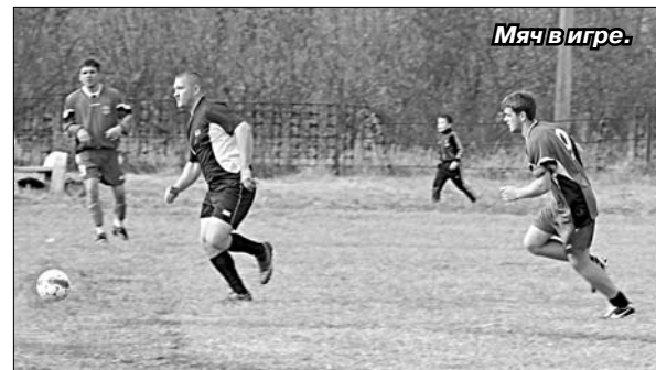
Мяч в игре.