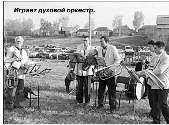
Играет духовой оркестр.