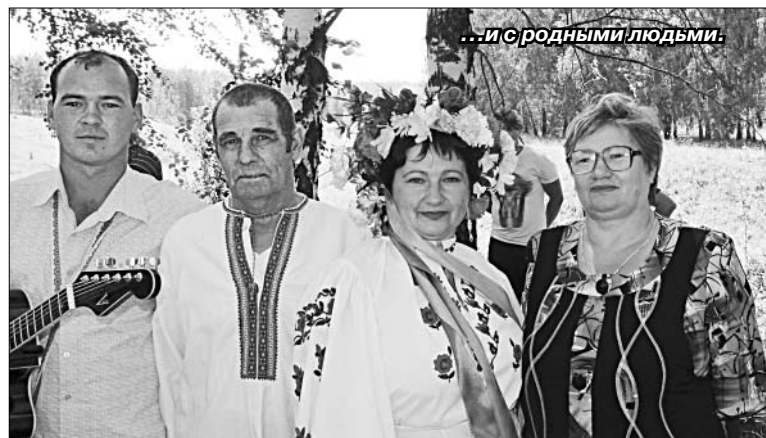
...и с родными людьми.

Папа родом из Украины. Судьба его забросила в Елецкий район во время