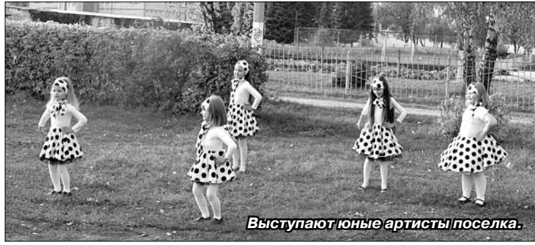
Выступают юные артисты поселка.

Газетный листок грел душу, позволял по-настоящему гордиться прошлым и уверенно смотреть в будущее. А оно вот — выходит на сцену. В нынешнем году в поселке родилось 13 малышей. В семьях соберутся за праздничным столом с радостью. И будет на нем — кубанский борщ и украинские вареники, адыгейский сыр и армянская долма, таджикские дыни и греческое вино и, конечно же, русская картошка с ядреным квасом. В поселении проживает множество национальностей. Наступает утро следующего дня, и солнце одинаково греет всех. Пусть живут люди в мире и согласии.