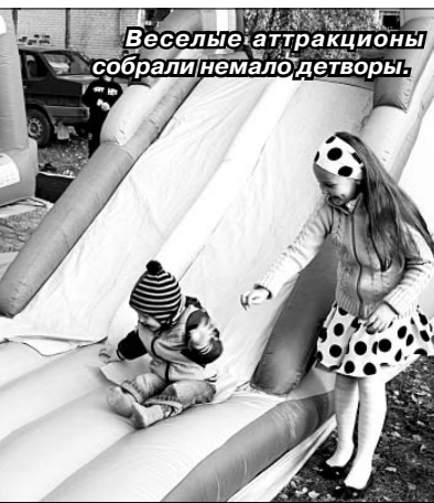
Веселые аттракционы собрали немало детворы.