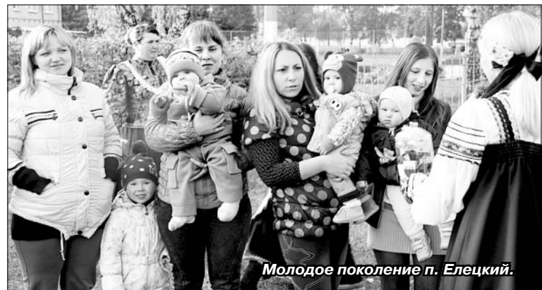
Молодое поколение п. Елецкий.