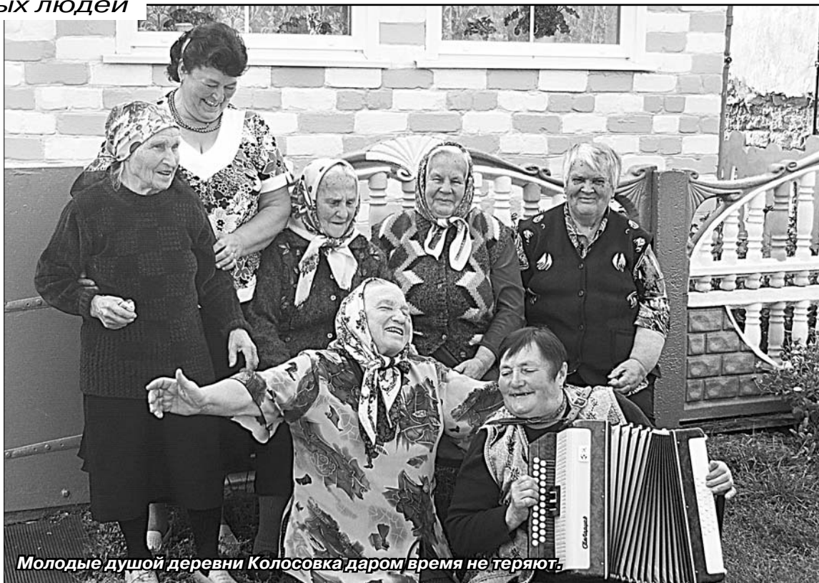
Молодые душой деревни Колосовка даром время не теряют.

Материалы читайте на 3-й стр. этого номера.