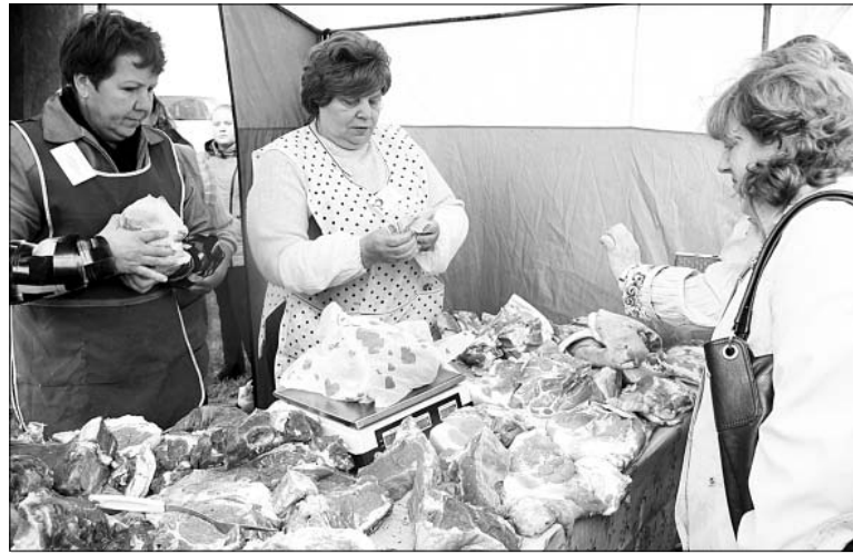
У «Елецкого заготовителя» был большой выбор мяса. Закупки вели в личных подворьях селян.