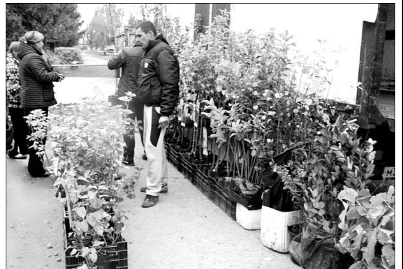
Ходовым товаром стали саженцы из с. Каменское.