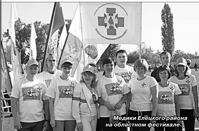
Медики Елецкого района на областном фестивале.