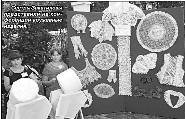
Сестры Закатиловы представили на конференции кружевные изделия.

И. ПРОКОФЬЕВА, директор Межпоселенческого координационно-методического центра.