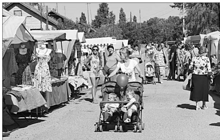
На областной ярмарке было многолюдно.

к ним — пеку лаваша разных видов, готовлю мясо для шашлыка. Снохи торты готовят, другую сдобу. Сегодня можно продавать помидоры,