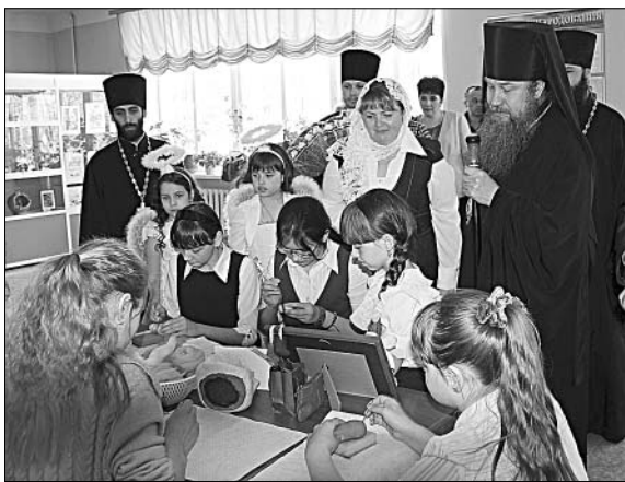
Приобщение детей к духовности в наши дни жизненно необходимо.