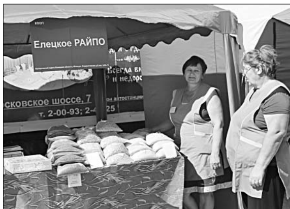
Товары Елецкого райпо пользовались спросом.

К тому же новые лица, новый товар — всегда в радость покупателям. Снарядить на ярмарку сельян из других поселений — дело не трудное, но хлопотное. Но свой товар, конкурирующий на рынке с другим, непременно отыщется. Поэтому торговые ряды со всех территорий района наверняка станут изюминкой ярмарки. Впрочем, поживем — увидим.