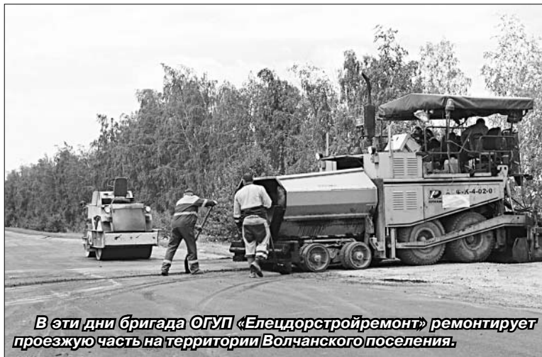
В эти дни бригада ОГУП «Елецдорстройремонт» ремонтирует проезжую часть на территории Волчанского поселения.