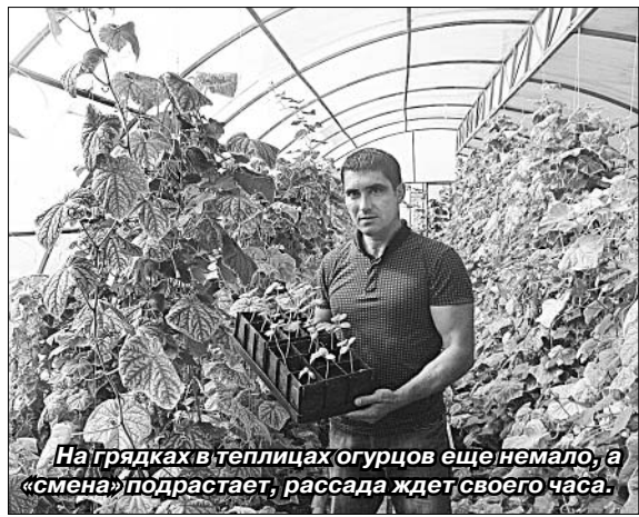
На грядках в теплицах огурцов еще немало, а «смена» подрастает, рассада ждет своего часа.