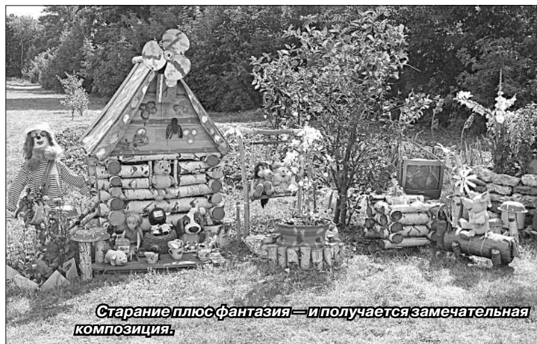
Старание плюс фантазия — и получается замечательная композиция.