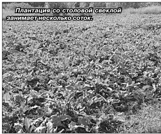
Плантация со столовой свеклой занимает несколько соток.