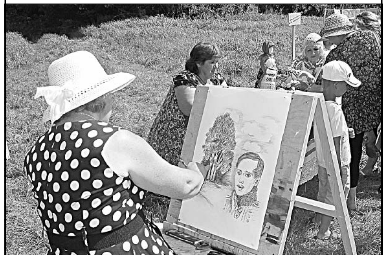
Лермонтов глазами современного художника.

Напоминаем, учитывать его величину необходимо при расчете различных выплат и денежных пособий.