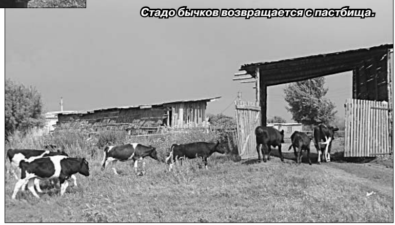
Стадо бычков возвращается с пастбища.