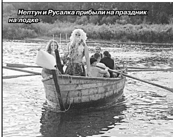
Нептун и Русалка прибыли на праздник на лодке