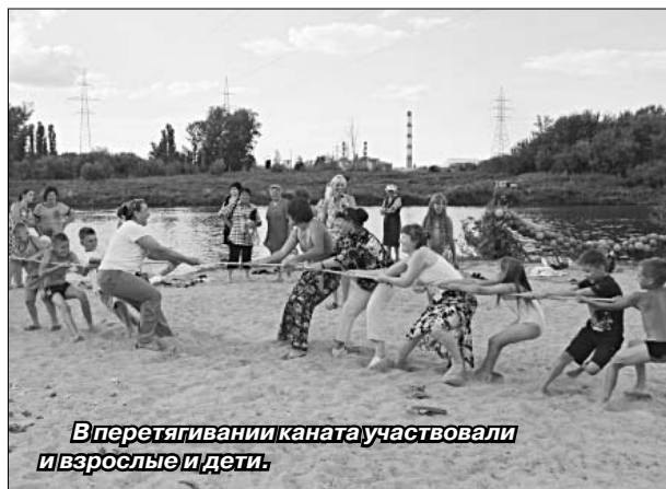
В перетягивании каната участвовали и взрослые и дети.