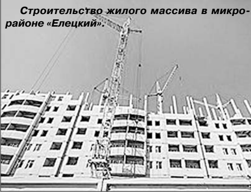
Строительство жилого массива в микрорайоне «Елецкий».