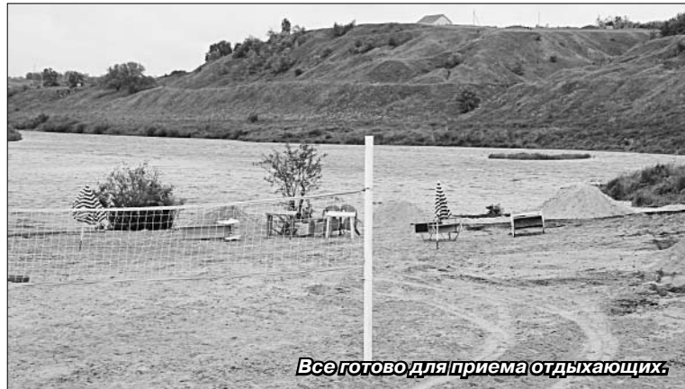
Все готово для приема отдыхающих.

Не забыли здесь и о контейнерах для мусора, установили таблички, призывающие сохранять чистоту. Территория обработана от клещей.