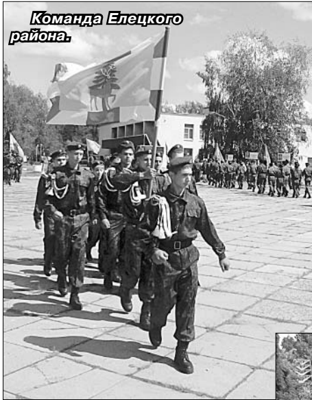
районов области. Среди них были и ельчане.

Организатором подобных соревнований, проходивших с 17 по 20 июня в условиях полевого размещения, выступил Центр патриотического воспитания Липецкой области.