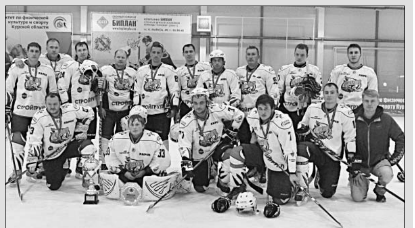
Команда «Сокол» умеет бороться за награды.

В рамках работы комиссий по легализации заработной платы проведены собеседования с 388 руководителями предприятий и индивидуальными предпринимателями. По состоянию на 01.06.2014 года повысили заработную плату 319 работодателей (в т. ч. ИП — 186). В результате увеличения заработной платы на 01.06.2014 года в бюджет дополнительно поступило НДФЛ в сумме 2253,0 тыс. руб. (в т. ч. ИП — 940 тыс. руб.).