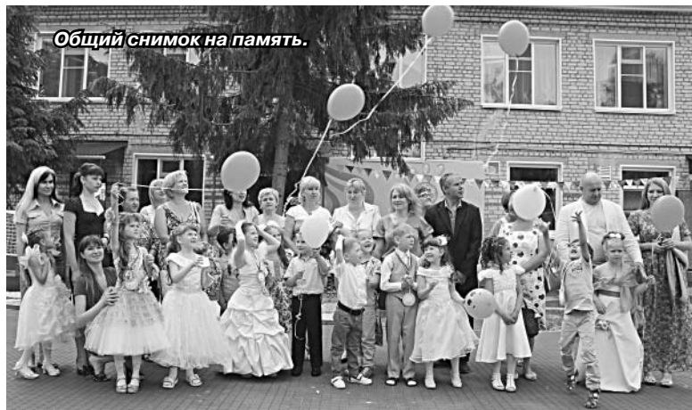
Общий снимок на память.

ство с новой для них школьной жизнью. Недавно выпускной бал состоялся в детском саду п. Ключ жизни.