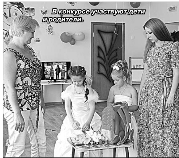
В конкурсе участвуют дети и родители.