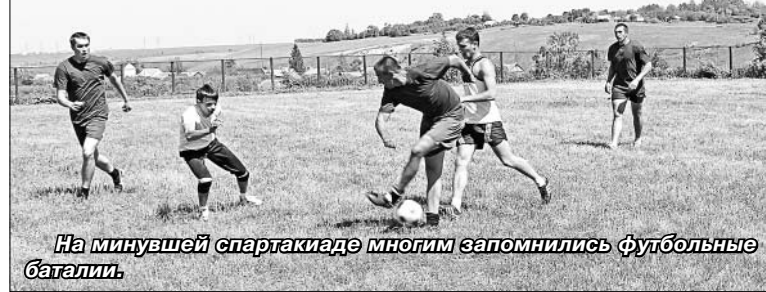
На минувшей спартакиаде многим запомнились футбольные баталии.

Хотелось бы обратить внимание на то, что в «Богатырских играх» приняли участие тоже три команды — из Больших Извал, Маяка и Малой Боевки, в фестивале женского спорта — команды Больших Извал, Казаков и Лавской территории. На соревнования