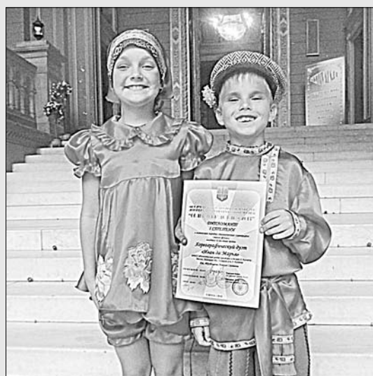
Дуэт «Иван да Марья» с дипломами фестиваля.