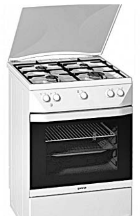
Подготовила И. МЕШАЕВА.

Чугунные конфорки можно чистить металлическими щетками с тонким ворсом или грубой тканью.