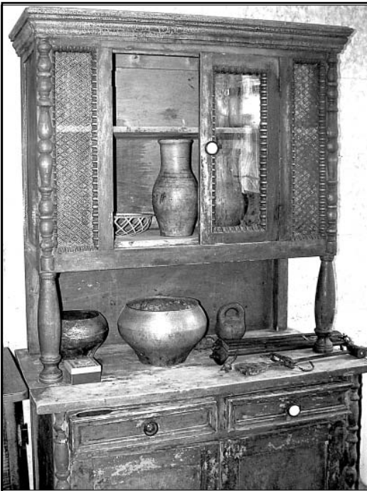
Экспонатов в комнате крестьянского быта уже немало.