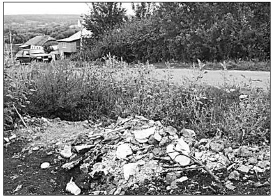
Свалка выросла вновь.

Жить в чистоте хочет каждый нормальный человек, но в тоже время многие возмущаются, что в их селе, на улице грязно. Они бесконечно обращаются в соответствующие службы, хотя по-хорошему можно решать проблему на месте, стоит лишь присмотреться к своим соседям. Ведь, к сожалению, некоторые жители Елецкого района предпочи-