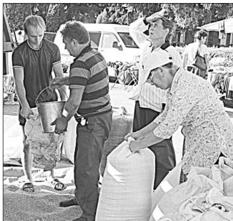
На зерно всегда есть покупатели.

Ярмарка выходного дня в селе Талица была, пожалуй, самой многолюдной за последнее время. На