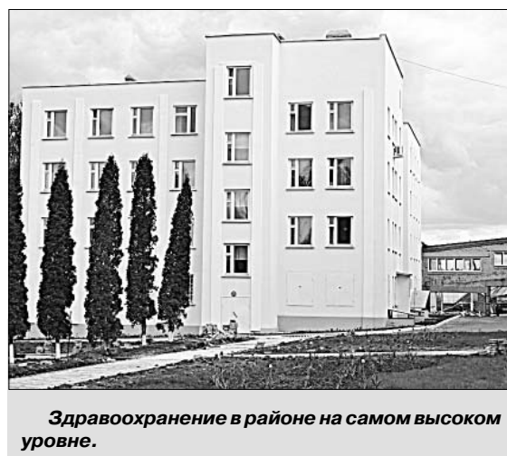
Здравоохранение в районе на самом высоком уровне.