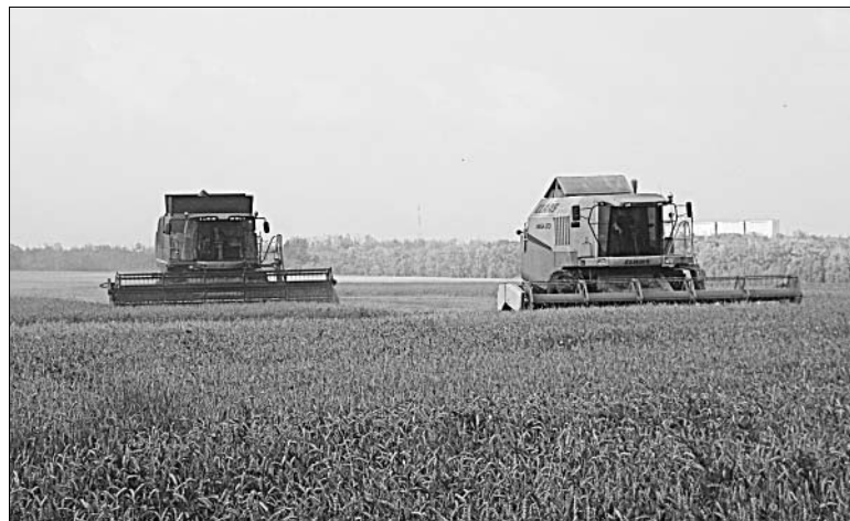
Елецкие аграрии получили отличный урожай.