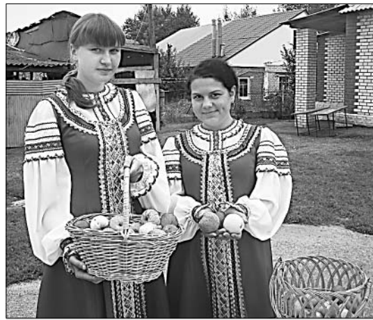
Сладкие плоды — угощение к Яблочному спасу.

администрации и администрация Колосовского поселения) не могли, потому подготовили для угощения сочные плоды. Причем, соблюдая обычаи, их освятил настоятель местной церкви отец Александр. Самодельные артисты потчевали яблоками каждого, кто пожелал. Большинство клали плоды в сумку, ведь отведать их, следуя православным канонам,