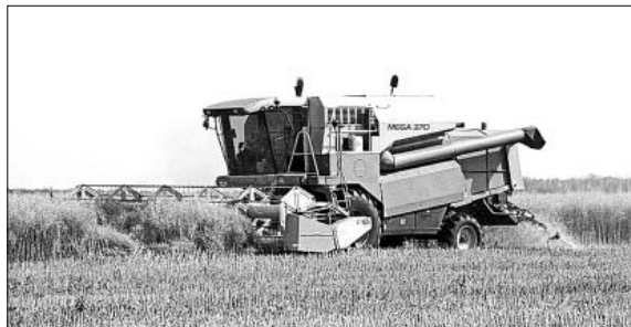
Уборка рапса идет без перебоев.

зяйстве одними из первых в районе убрали яровую пшеницу и ячмень. Но это совсем не значит, что уборочная кампания на этом полностью завершилась.