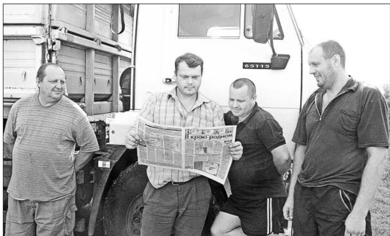
Коллектив водителей ООО «Колос-Агро».