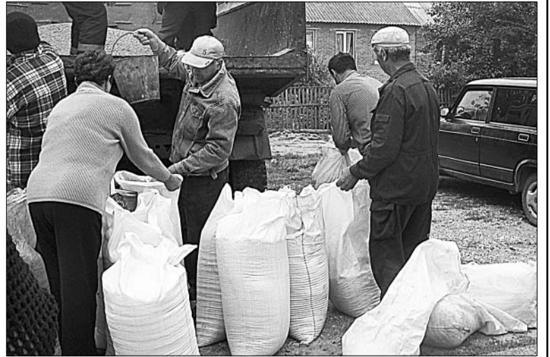
Самый ходовой товар на ярмарке — зерно.

администрации и администрация Колосовского поселения) не могли, потому подготовили для угощения сочные плоды. Причем, соблюдая обычаи, их освятил настоятель местной церкви отец Александр. Самодельные артисты потчевали яблоками каждого, кто пожелал. Большинство клали плоды в сумку, ведь отведать их, следуя православным канонам,