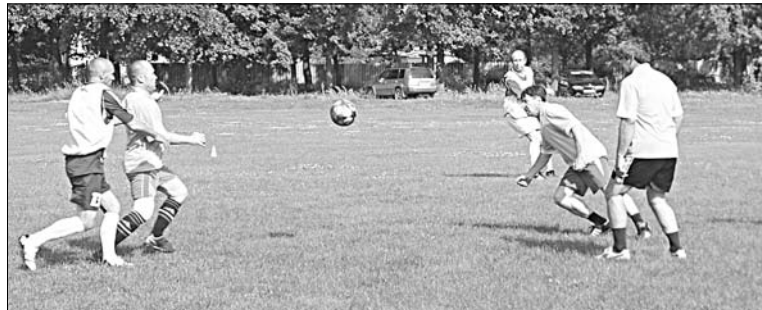
Борьба за мяч была азартной.