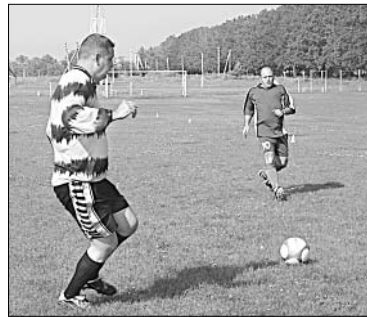
Опасная ситуация у ворот: выход один на один...

Синоптики обещали зной в воскресенье. Такой прогноз вряд ли порадовал любителей футбола: под палящими лучами солнца гонять мяч непросто. Но, как говорится, охота пуще неволи. Поэтому на традиционные районные