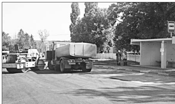
Бригада ОГУП «Елецдорстройремонт» обустроивает поворотные-разворотные площадки в п. Ключ жизни.