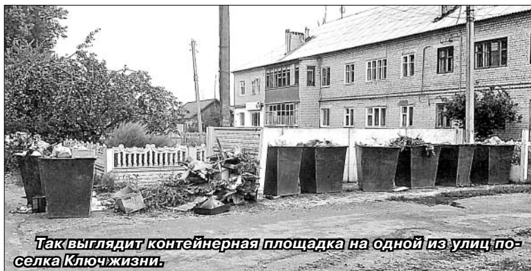
Так выглядит контейнерная площадка на одной из улиц поселка Ключ жизни.

Но и другое немаловажно: нельзя воспитывать наших детей в невежестве и бескультурье. Наивно полагать, что ребенок, играющий по соседству с мусорными свалками, их