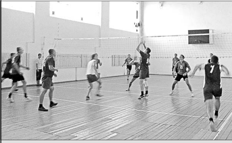
Волейболисты играли азартно, уверенно.

Заявления о предоставлении в аренду земельного участка направлять в администрацию Елецкого муниципального района по адресу: Липецкая область, г. Елец, ул. 9-е Декабря, д. 54, кабинет № 7.