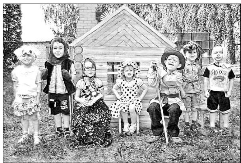
Воспитанники детского сада п. Солидарность.

ков. Недавно здесь подготовили для малышей праздник «Радуга детства».