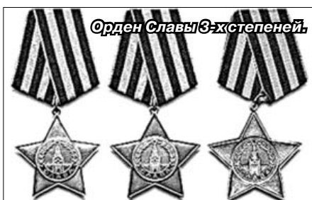
Орден Славы 3-х степеней.

войны художник работал в жанре плаката. Всего он создал более сотни живописных и графических работ, эскизов к значкам, плакатов, 200 этюдов и набросков пейзажей, натюрмортов, портретов, сюжетных бытовых, сатирических, юмористических зарисовок.