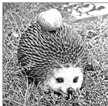
Еж — искусственный, яблоко — настоящее.

Летают они и возле искусственных цветов. Яркие пластмассовые поделки теряются среди пестрых астр и цинний. Там же — огромные бабочки машут