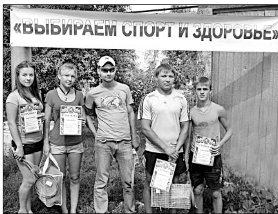
Победители, призеры соревнований выбрали спорт и здоровье. И не прогадали.