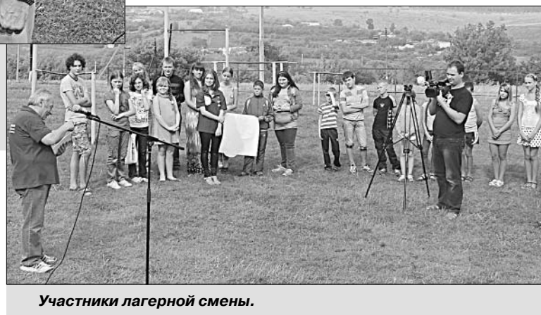
Участники лагерной смены.

Некоторые из них еще раньше побывали здесь в статусе участников