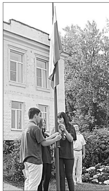
Торжественное поднятие флага.