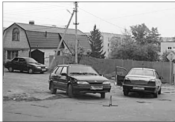
При содействии сотрудников ОГИБДД ОМВД по Елецкому району подготовила А. МИТУСОВА.