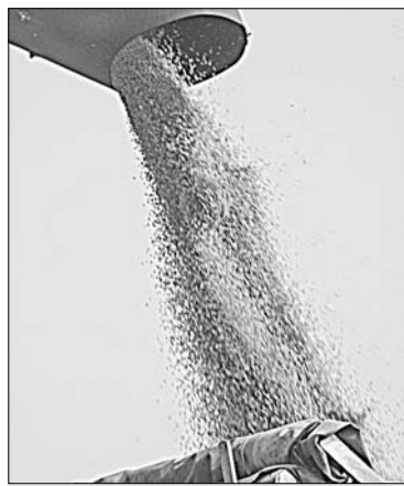
Зерно из бункера «бежит» стремительным потоком.

...Через несколько минут после начала уборки на одном из комбайнов загорелся маячок — сигнал, что бункер полный. Других указаний водителю машины не потребовалось: техника тут же двинулась к центру поля