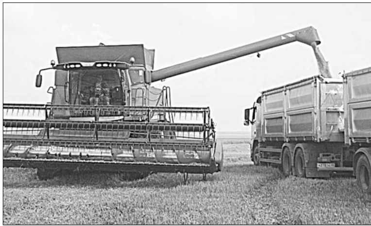
Уборочный конвейер — в действии.