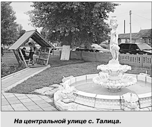
На центральной улице с. Талица.

касси. Мы сфотографировались на фоне памятника Черкасскому огурцу. Признаться, такие улицы, как здесь, можно было увидеть только в журнале. Вокруг идеальная чистота. Вот это деревня! Здесь нас ждало брендовое угощение — огурчики с грядки. Спасибо за такой теплый прием.