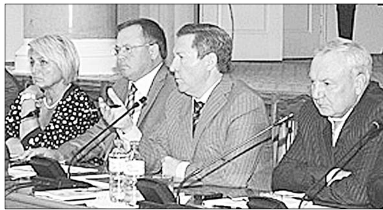
Заседание Совета администрации области вел глава региона Олег Королев. (Фото пресс-службы администрации области).

— Анализируя ситуацию за истекшие шесть месяцев, мы невольно сверяем ее с теми тенденциями, которые существуют в мире, — сказал