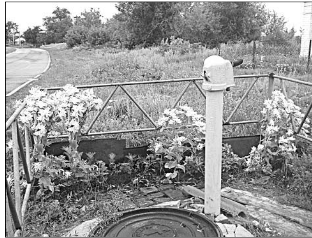
Около каждой колонки — порядок.