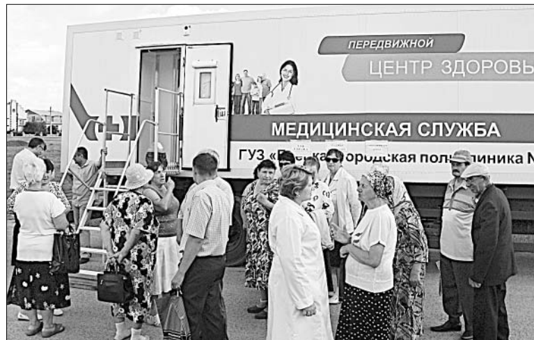
Работает передвижной «Центр здоровья».

Врачи областной детской больницы разместились отдельно, в кабинетах местной школы. Так было удобнее и для специалистов, и, конечно же, для пациентов, ведь некоторые из них совсем маленькие,