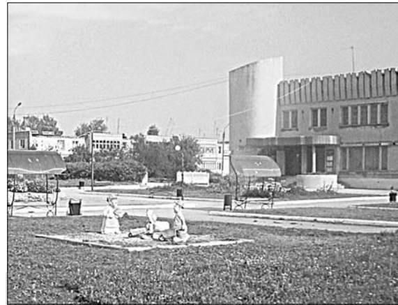
Территория возле ДК.

О другом хочется сказать. Вот сельское кладбище. Ему более ста лет. Здесь также назрело немало