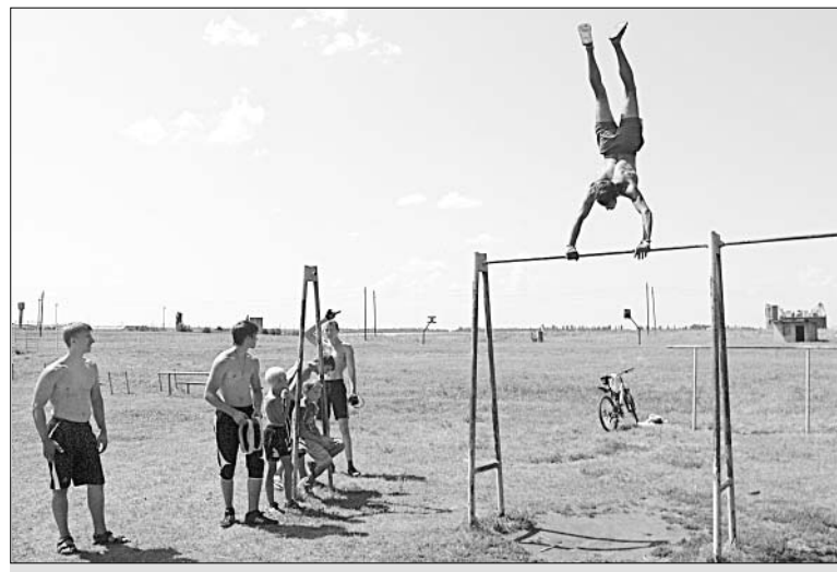
Выступление «турникменов» собрало зрителей.