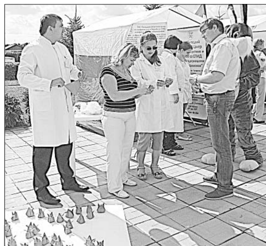
На информационных площадках можно было получить консультации по самым разным вопросам.