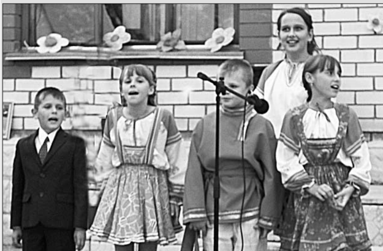
Выступают участники ансамбля «Радуга».

Пусть не выйдут на большую сцену, но то, что дружат с песней, изучают народную культуру, наверняка лишним в жизни не будет.