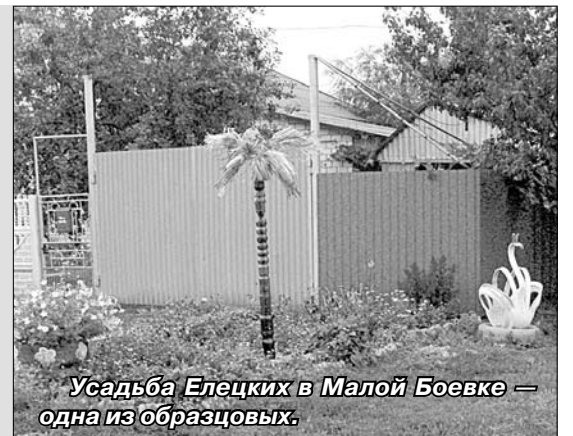
Усадьба Елецких в Малой Боевке — одна из образцовых.