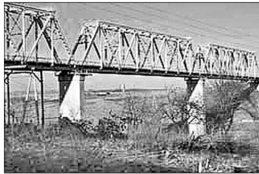
Мост в селе Казаки.

Когда немцы подступили к Казакам, мост взорвали. Это было