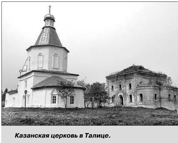
Казанская церковь в Талице.