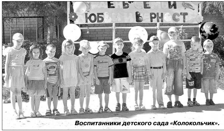
Воспитанники детского сада «Колокольчик».