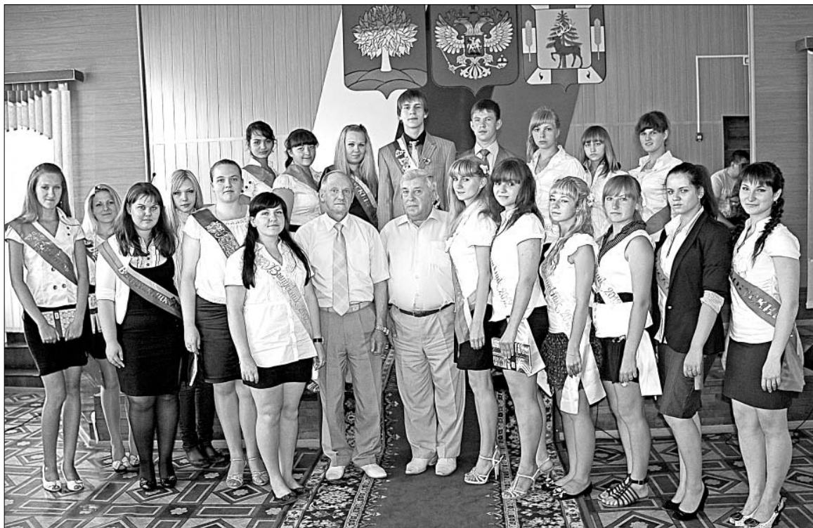
Этот снимок был сделан во время встречи руководителей района с выпускниками школ этого года — золотыми и серебряными медалистами. На память о том событии у ребят останутся не только верные напутственные слова, но и фотография.

(Подробнее о встрече читайте на 2-й стр. газеты).