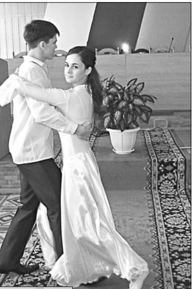
Прощальный школьный вальс.