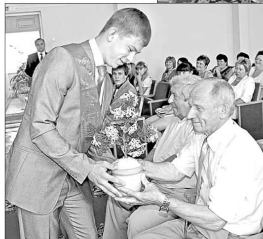
Подарок от выпускников главе района.